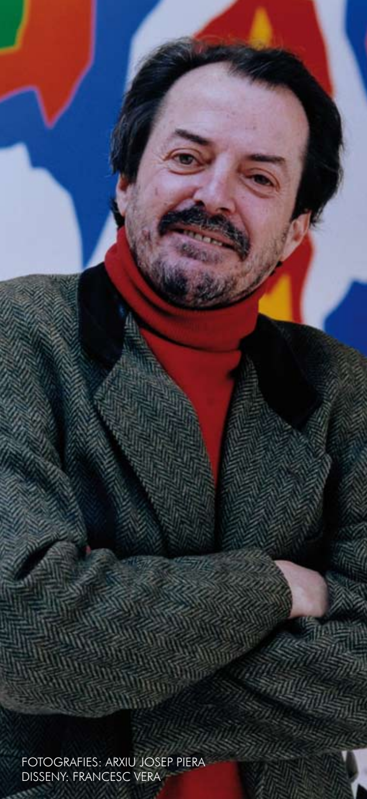
DISSENY: FRANCESC VERA